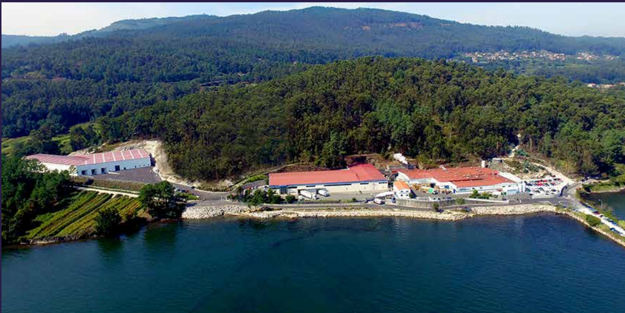
Nuestra fábrica ubicada en Vilaboa, Pontevedra (España) / Our factory in Vilaboa, Pontevedra (Spain)