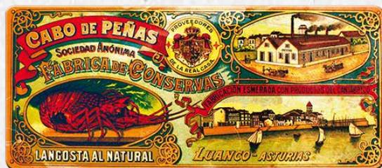
CABO DE PEÑAS, primera mitad del siglo XX. CABO DE PEÑAS, first half of the twentieth century.

CABO DE PEÑAS cuenta con el sello de Garantía Galicia Calidade, que certifica la extraordinaria calidad y origen de los productos que producimos y comercializamos.